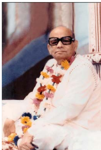
Shrii Shrii Anandamurti (Bábá)